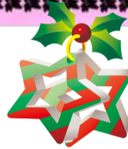
106 Tanya 劉天穎