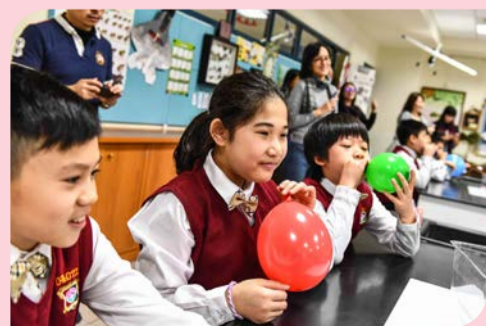
▲ 在歡樂的吹氣球活動中小朋友認識空氣流動可以產生風力