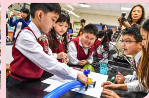
▲ 利用空氣產生的力量來推動車子