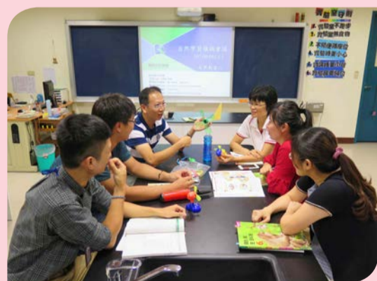
▲ 自然田園團隊每周利用共備會議進行課程研究

進行年度主題研究，歷年研究主題包含田園、天文、力學、能源等。例如在能源主題中，孩子認識風、水流及熱可以產生動能並且發電，以及電與磁之間的關係。將四至六年級相同主題的內容作縱向聯結、自編課程，讓課程循序漸進，更具聯貫性，由淺入深進、加深加廣的課程規劃，讓學生能達到學習目標，獲得更有效率而豐富的學習。