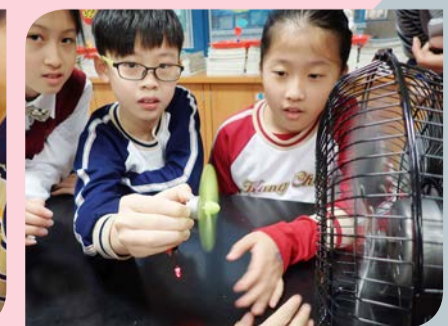
▲ 藉由風的力量可以讓馬達轉動發電來製作風力發電機