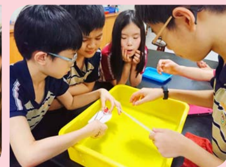
▲ 動手自製利用銅管加熱的動力船