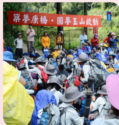
▲ 登玉山：增加人生顛峰經驗

康橋的教育理念是透過學校、班級所安排的各類型團體行事活動，讓孩子在團體活動中感覺歸屬感，獲得滿足，並享受成就；繼而引發行為的自發性、思考的自主性、與人相處的協調性，最後培養「有個性、能自立」的個人。