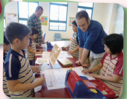
3. Writing becomes necessary when taking customers' orders.