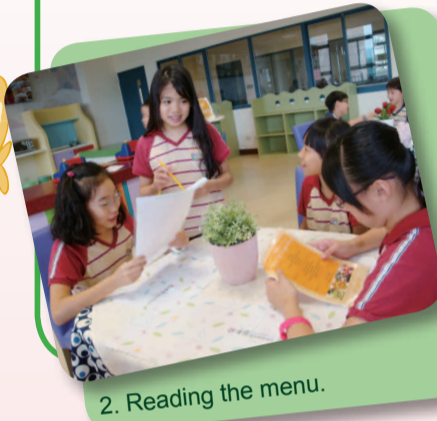
2. Reading the menu.