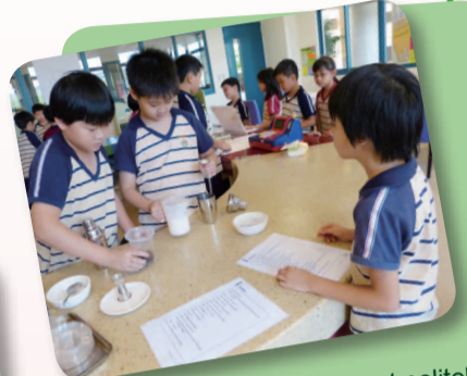
1. How to make a request politely? (x) I want black tea. (√) I would like black tea.

When learning a language, students need experience with the purposes and functions of the language in order to master it. Besides learning concepts and completing worksheets in the classroom, students learn how to use language skills (listening, speaking, reading, and writing) accurately and appropriately in different venues in English Village.