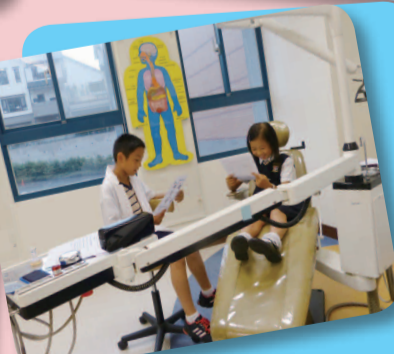
4. Patients need to know how to describe their symptoms to the doctor so he/she can advise them.

English Village offers hands-on activities that enable students to explore different settings, and scenarios, and also occupations in an enjoyable, meaningful manner.