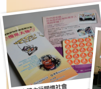
▲ 身體力行關懷社會

孩子懂得感恩、知福、惜福，建立起自己的信心，告訴自己：不必靠外在的比較或讚美，來肯定自我價值；而是身體力行「對的善念」。這些多元活動的學習，深植於孩子心中的「愛」，就是無法度量的品德！