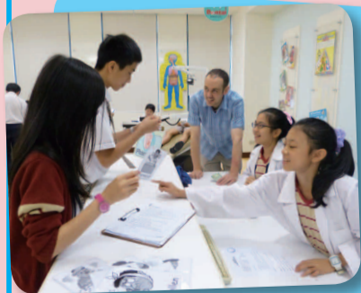
3. A pharmacist dispenses medicine and instructions on its use.