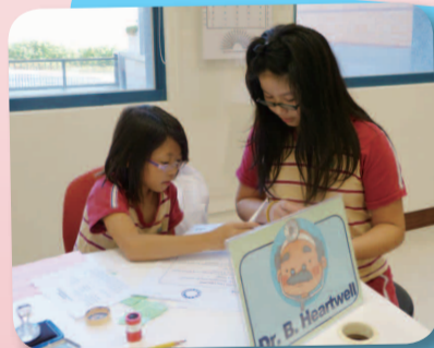
2. A doctor gives a patient advice from medical notes.