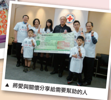
▲ 將愛與關懷分享給需要幫助的人