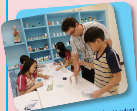
1. A receptionist tells patients what to do in a clinic.

When students role-play in English Village, they practice dialogues, leading to familiarity with the conventions of different conversations. They conduct, and engage each other in the conversations and content that they have learned in the classroom. Their self-esteem improves when their language enables them to complete tasks and help their classmates.