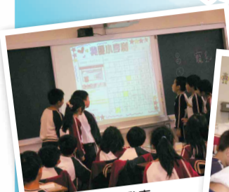
▲ 小組共同創作發表