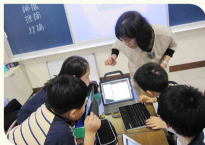
▲ 透過資訊融入，奠定自我學習的基礎

秉持著創校的理念，康橋以學生為主體，以最優質的師資，持續的創新活化教學，有效的打造學習共同體氛圍。「學習」讓康橋的孩子視野更遼闊，心胸更寬廣，思考更周延，表達更貼切，為培育具國際競爭力的社會菁英，許孩子一個美麗的未來，做好扎實的準備。