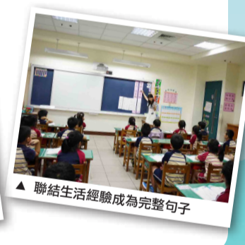
▲ 聯結生活經驗成為完整句子