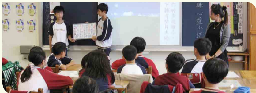
▲ 經過小組共作和分享，讓學習更有趣