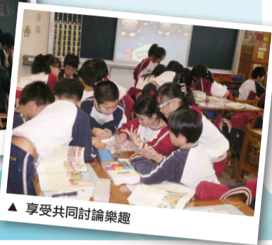
▲ 享受共同討論樂趣