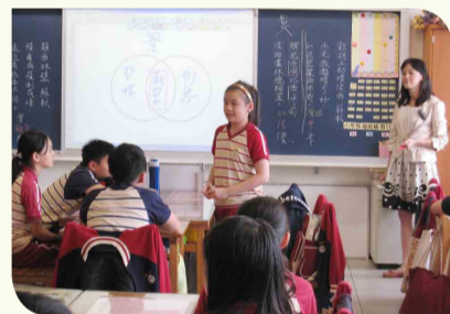
▲ 教師建構學習鷹架，將學習權交給學生