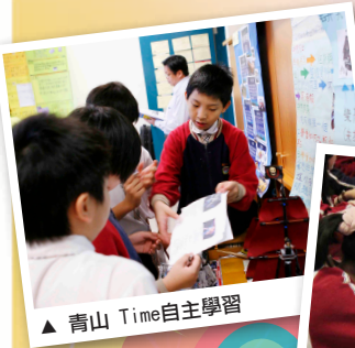
▲ 青山 Time自主學習