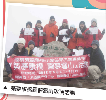
▲ 築夢康橋圓夢雪山攻頂活動