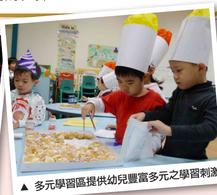
▲ 多元學習區提供幼兒豐富多元之學習刺激