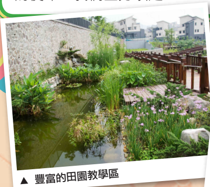
▲ 豐富的田園教學區

為孩子打造安全精緻的校園環境，是康橋不斷努力的目標，而「誓為教學服務最有力的後盾」，則是總務部無可推卸的使命，我們全力以赴。