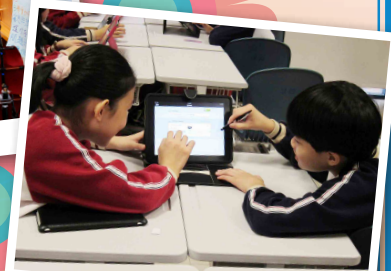
▲ 落實資訊融入教學，提高學生學習興趣