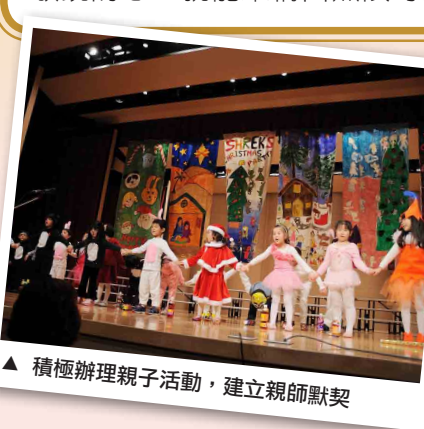
▲ 積極辦理親子活動，建立親師默契

我們相信，讓孩子熱情勇敢的探索，張開好奇的眼、懷著敏銳的心，就能架構出無限可能的世界！