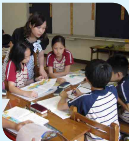
▲ 小組討論培養溝通能力

有人說：「成功的人生取決於良好的品格，因為良好品格能帶來幸福人生，培養好品格是孩子一輩子受用的無形資產」。由此可見，品格力是決戰人生成敗的關鍵能力。個性決定態度，態度決定人生的高度、深度與廣度，透過教育的過程，培養孩子能先自我建立自信、能在人群社會自立、能與自然環境共生、能和國際未來共榮，更能以積極、正向發揮生命無限潛能。