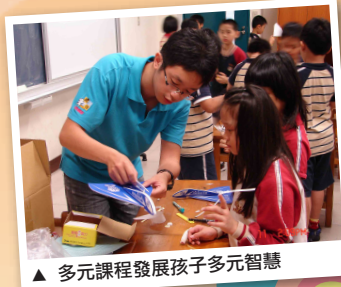
▲ 多元課程發展孩子多元智慧

我們相信，每個孩子都有解決問題的本能，藉由我們所規劃各項課程，發掘孩子潛在能力，超越困境。若加上您的鼓勵與支持，孩子會更勇敢向前進。