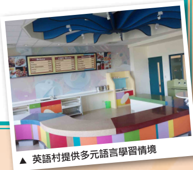
▲ 英語村提供多元語言學習情境

英語是帶領孩子通往國際的鑰匙，然而，學會從不同的角度思考、充滿自信的表達能力，樂於學習，勇於解決問題，更是成為21世紀領導者的關鍵能力。