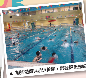
▲ 加強體育與游泳教學，鍛鍊健康體魄