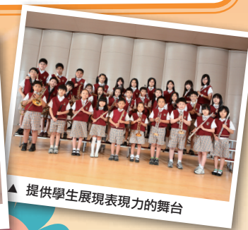
▲ 提供學生展現表現力的舞台