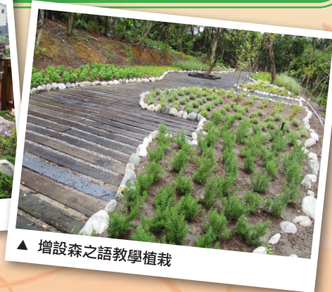
▲ 增設森之語教學植栽