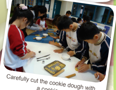
Carefully cut the cookie dough with a cookie cutter.