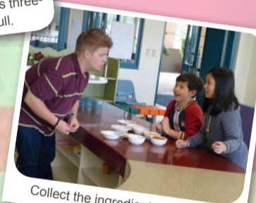
Collect the ingredients you need.