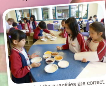
Check that the quantities are correct.