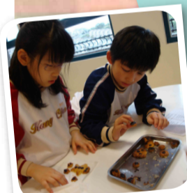
Look at my gingerbread man cookie! Is it baked?