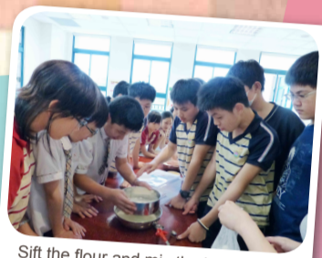
Sift the flour and mix the ingredients.