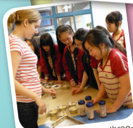
Fill the cupcake liners three-quarters full.